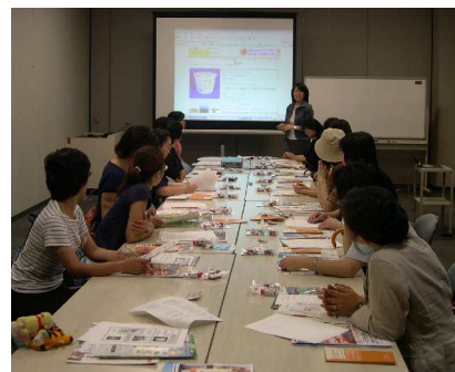
1テーブル形式の会場(福岡)