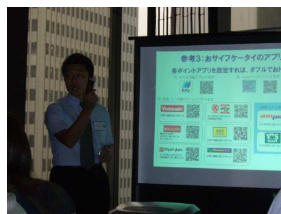
企業様プレゼン(東京)