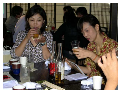
サンプルを試飲(東京)