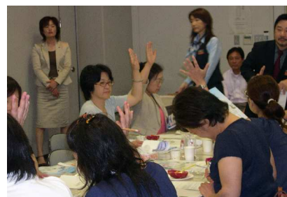
活発な意見交換(福岡)