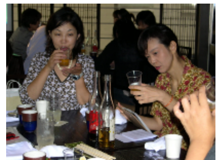
サンプルを試飲(東京)