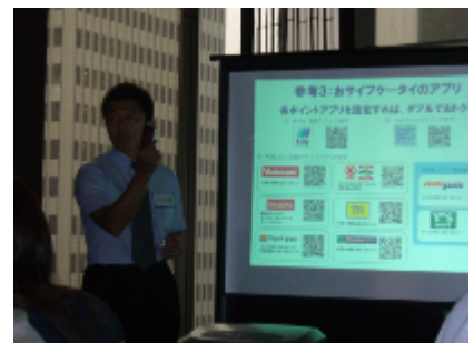
企業様プレゼン(東京)