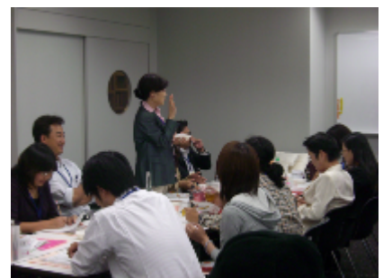
参加者からの意見(大阪)