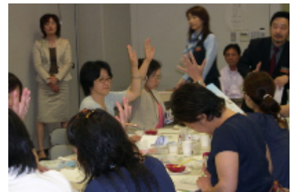
活発な意見交換(福岡)