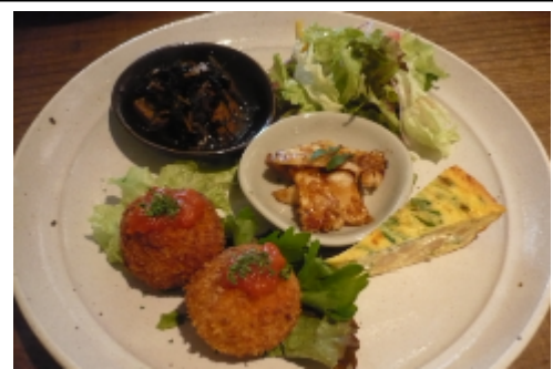
「家庭のおもてなし料理」をコンセプトにした ランチプレート